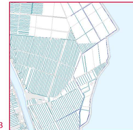
3 Scoline e canali di irrigazione tipici dei paesaggi orientali, dedicati alle colture estensive. Le opere sono state realizzate per lo più nel corso della Bonifica meccanizzata avviata nel 1800.