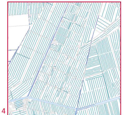
4 Densità e regolarità delle opere di irrigazione tipiche degli appezzamenti della Riforma agraria avviata nei territori del Polesine occidentale nel corso degli anni '50.